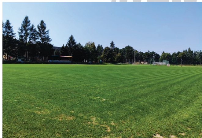
Płyta głównego boiska