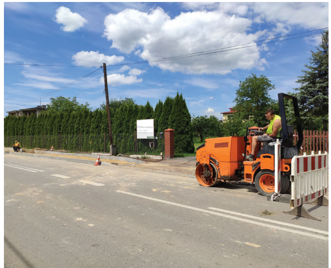
Budowa chodnika w Janowicach