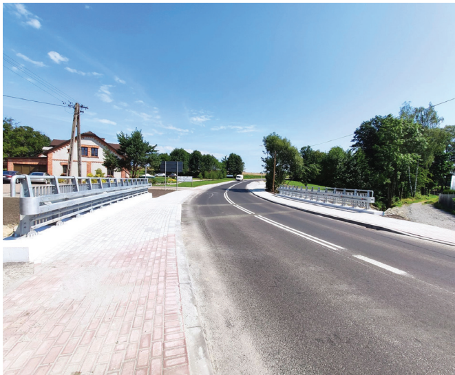
Przebudowa ul. Krakowskiej