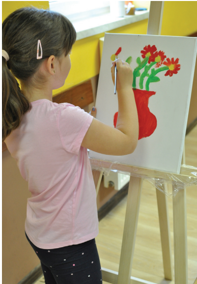
Zajęcia plastyczne z wykorzystaniem sztalug

Chyba najważniejszym czasem w rozwoju człowieka jest dzieciństwo. Wtedy kształtuje się nasz obraz świata, znajdujemy odpowiednie dla siebie zainteresowania, uczymy się interakcji z rodziną i przyjaciółmi. Niezwykle „plastyczny” i chłonny umysł dziecka