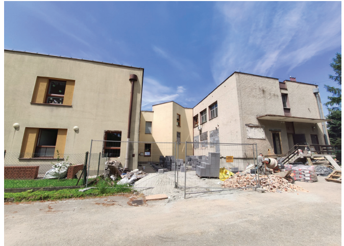
Budowa Klubu Dziecięcego w Kaniowie

z nawierzchnią, chodniki dla pieszych z kanalizacją deszczową, jak również prace brukarskie na nowych i przekładanych chodnikach.