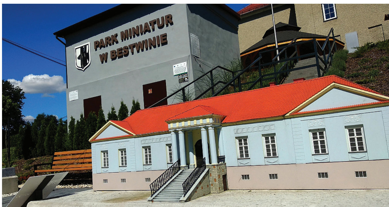
Park Miniatur w Bestwinie

Udział naszej gminy w tym przedsięwzięciu jest bezpłatny.