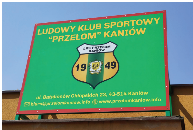
Nowy szyld – tablica informacyjna

bem wolontariusze. Pomalowano metalowy płotek przy boisku, zainstalowano szyld na budynku klubowym, wyczyszczono ławki i wykonano konieczne prace poprawiające ogólną estetykę. Koszty pokryto ze składek członkowskich oraz dzięki uprzejmości prywatnego sponsora.