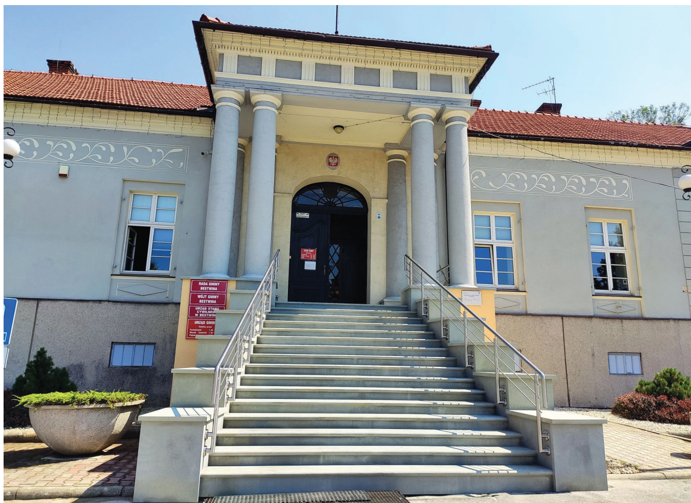
Główne wejście do Urzędu Gminy